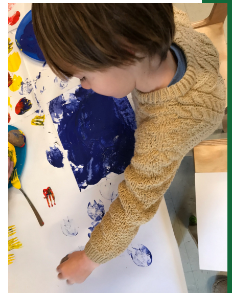
Tulipanes con timbre de papa, con tenedor y con pedacitos de papel