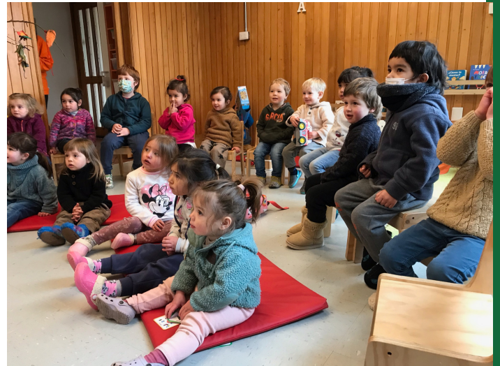
La representación recibe un 100% de atención