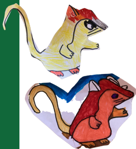
Rita coloreada por los niños