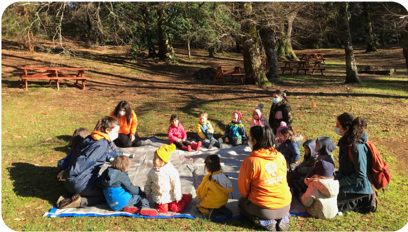
Nos tocaron días muy fríos, pero hermosos