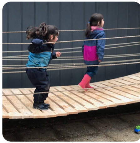
Saltando es más entretenido