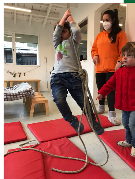
Trepano como monitos del monte