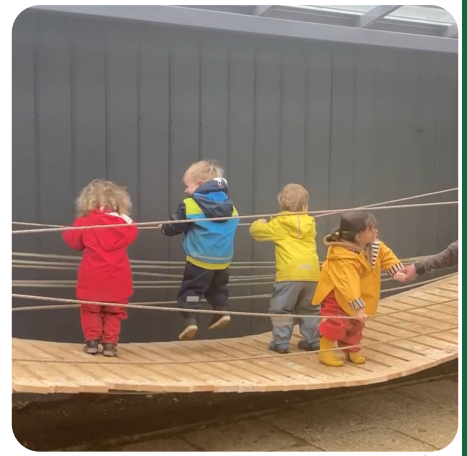
Intentando mantenerse de pie