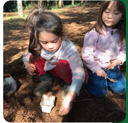
Estación de cocina